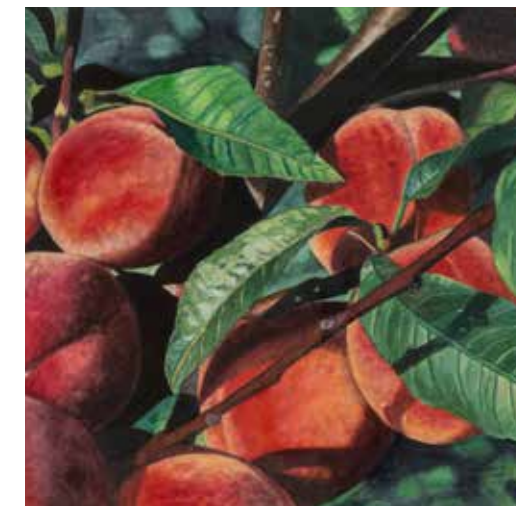
Abb. v.l.n.r. und v.o.n.u. Maruša Sagadin, Blaue Lippen I, 2024, Acrylharz, Styropor, Pigmente, Metall, Lack, 148 x 55 x 30 cm © VG Bild-Kunst, Bonn 2025; Emily Mae Smith, Painter, Big Banana, 2014 Zeichenstift auf Papier, 41,91 x 34,29 cm, Courtesy Contemporary Fine Arts, Foto: Charles Benton; Alicja Kwade, CitrusQuantum, 2023, Bronze, Marmor, 20 x 15 x 15 cm © Alicja Kwade, Foto: Roman März; Berend Strik, Revisiting the idea of incredible fresh fruit, 2011, Mischtechnik, Collage auf C-Print, 60 x 90 cm © VG Bild-Kunst, Bonn 2025; Antje Dorn, Bananen (aus der Serie Imbisse), 2003, Tusche auf Papier, 21 x 29,7cm © by: Antje Dorn, Berlin / VG Bild-Kunst, Bonn 2025; Thomas Scheibitz, Stilleben, 2009, Öl, Vinyl auf Leinwand, 120 x 80 cm © VG Bild-Kunst, Bonn 2025; Marcus Jahmal, Still Life, 2023, Öl auf Leinwand, 127 x 152,4 cm © Marcus Jahmal and courtesy Anton Kern Gallery, New York; Karin Kneffel, Pfirsiche, 1994, Aquarell auf Büttenpapier, 78 x 58 cm © VG Bild-Kunst, Bonn 2025; Ai Weiwei, Wassermelon, 2006, Porzellan, ø 38 cm © Ai Weiwei Studio, courtesy Ai Weiwei Studio and Lisson Gallery Alle Werke © und courtesy Kunststiftung Rainer Wild, Heidelberg